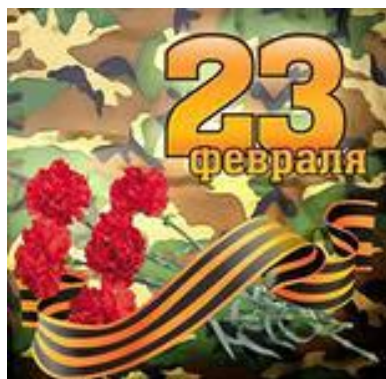
Защитники Отечества родного...

Две старых фотографии, два деда, Со стен как будто смотрят на меня. Один погиб почти перед победой, Другой пропал в немецких лагерях.